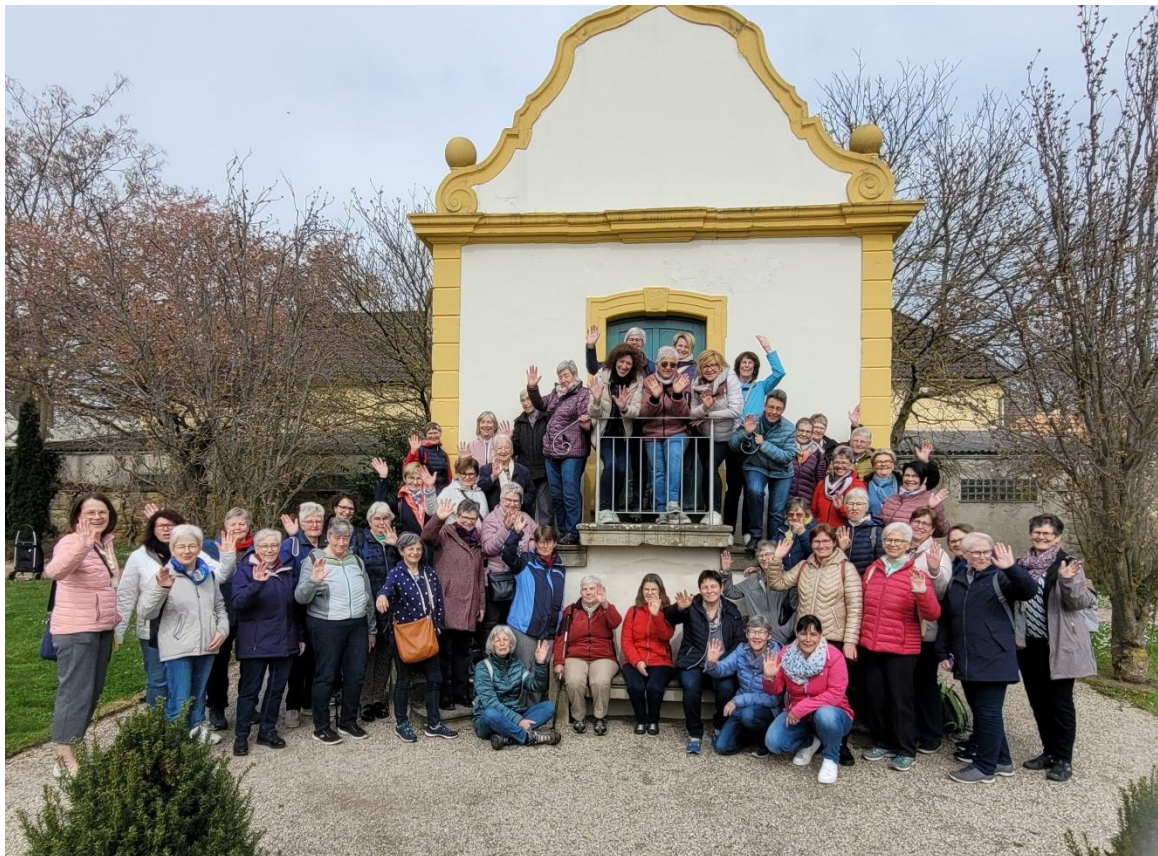
Frühlingsreise Mandelblüten in der Pfalz 2024

„Frauen brauchen andere Frauen in ihrem Leben, die ihnen sagen, wie toll sie sind. Kein Konkurrenzkampf, keine Lästereien, keine Eifersucht. Nur Liebe, gegenseitige Unterstützung und gute Energie.“