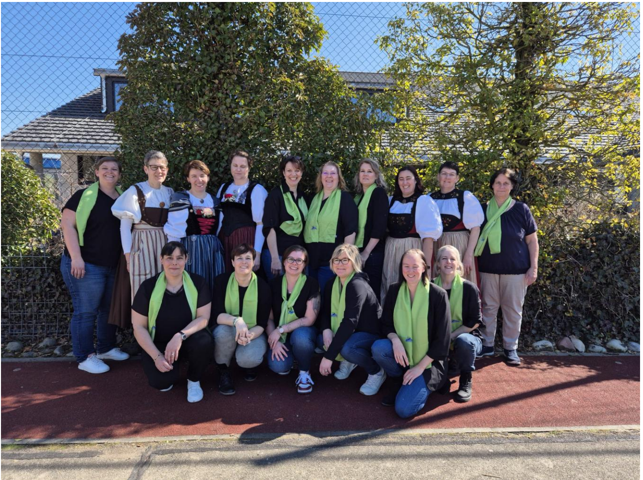
ALFV Vorstand 2025

„Kaum etwas macht uns so viel Angst, wie die Entscheidung, einen neuen Weg zu gehen. und kaum etwas bietet so viele Möglichkeiten“ unbekannt