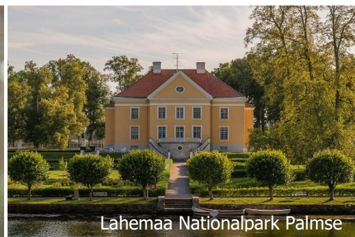
Lahemaa Nationalpark Palmse